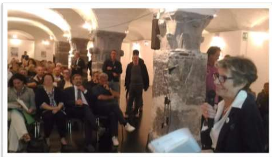
Saluti e interventi