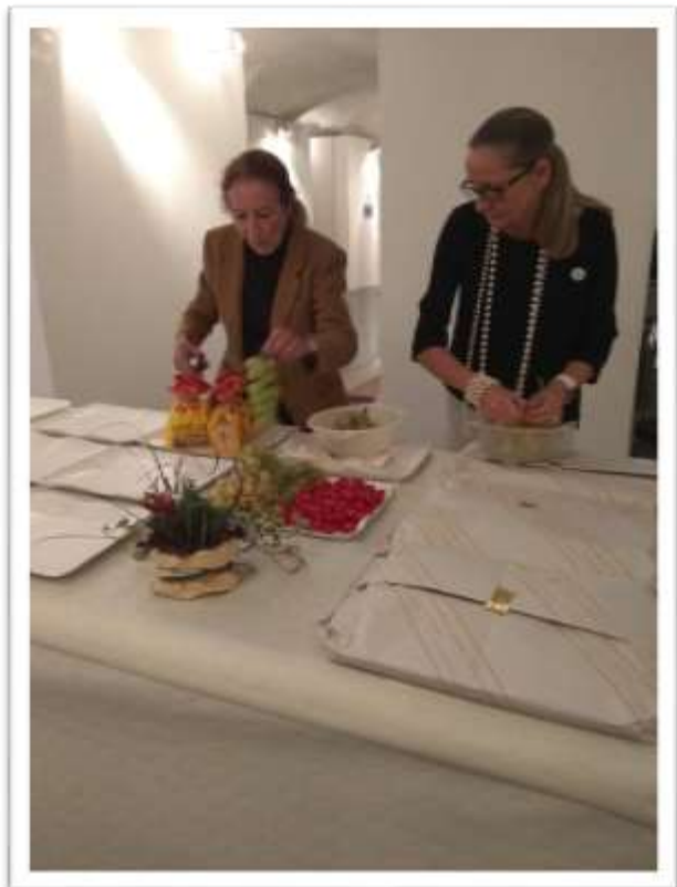
Accoglienza ospiti e allestimento buffet