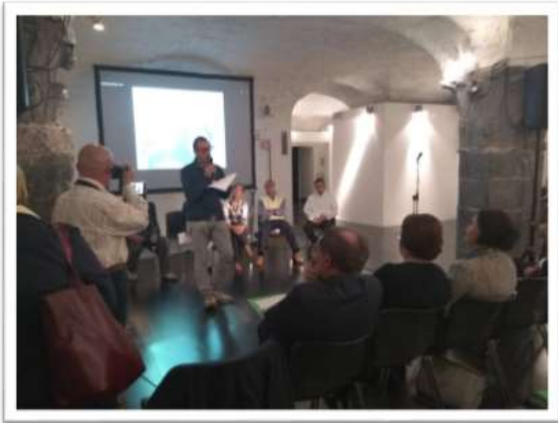
Interventi delle famiglie